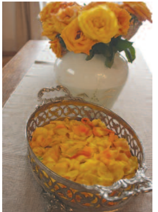
Erzsébet rózsákkal teli tálkosara időtlen fények közt repültem a fényszigetenger porszemszigetén szigetporszemek fényporszeme, én.

s lett élet, halál, lett történetük, s míg minden jött s tűnt, ismétlődve, ma, tegnap, holnap, (...)