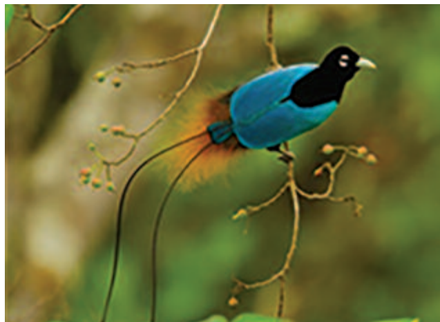
Kék paradicsommadár (Paradisaea rudolphi)

A finom legyező tövén indiai vörös színű ívelt csík húzódik. Hosszú, egyenes és nagyon keskeny zászlójú sza- lagtollai túlnyúlnak a legyezőn, és oldalt lefelé fordulnak. A