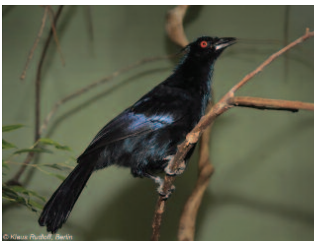
Trombitás paradicsommadár (Phonygammus keraudrenii)

dürgés tetőfokán a madár csípőjéből ringatja lelógó testét, s ennek következtében a legyezőtollak táncolnak és lebegnek.