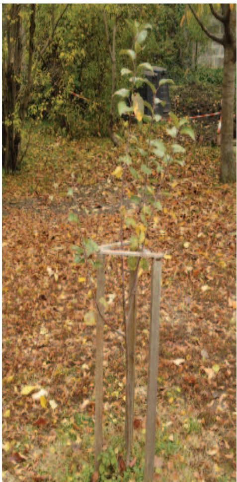
Almfacsemete Bolyai pónyikjéről