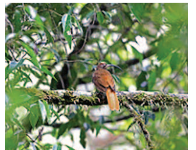
Dolmányos paradicsommadár (Drepanornis albertisi)

A farka közepes hosszúságú, fejének oldalai kékes csupa- szok, a háta teljesen rozsdabarna. A meghosszabbodott torok- tollak, valamint a melltollak oldalról borítják a testet, mint valami kettős pelerin. A felső köpeny oldalsó tollai arany- és bíborszínben csillognak, a test alja szép acélilobya színű.